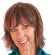
Claudine Villemot-Kienzle Center for Human Emergence, Allemagne- Autriche-Suisse www.claudinevillemot.de http://www.integrativberatung.de/franz/theoretische%20modelle.htm

Si nous bouclons maintenant le cercle et reprenons la vision du vol d'oiseau, nous pouvons ajouter à notre sujet une perspective supplémentaire. Inséparables de notre condition d'être humains sont les maladies qui nous ont accompagné et défié tout au cours de notre histoire individuelle et collective et qui nous sollicitent encore. A peine nos souffrances sont-elles surmontées que d'autres apparaissent. Il semble que chaque époque développe ses propres affections. Si comme Aristote et Hegel, nous percevons un Telos dans notre développement évolutionnaire, c'est-à-dire une force qui oriente le cours de l'univers, alors nous reconnaissons un sens profond dans tout ce qui nous arrive. Le sens des maladies serait-il de nous faire voir les points aveugles collectifs dans notre façon de vivre ensemble et d'organiser notre vie sur cette planète ? Est-ce que nos corps pourraient être le reflet de la souffrance globale de notre psychisme ? Nos symptômes nous offrent-ils des métaphores qui nous montrent quelle guérison notre âme réclame ? Alors nos semblables souffrant d'EHS seraient les messagers involontaires de signes décisifs lesquels pourraient changer notre niveau de conscience, si au-delà de l'ignorance et de la peur nous savons les décoder.